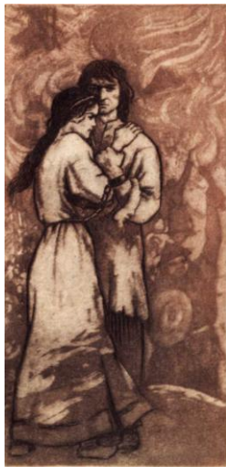
— Ти будеш счастливою мати! Тухольцями...